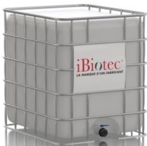
Kontajner GRV s objemom 1000 L