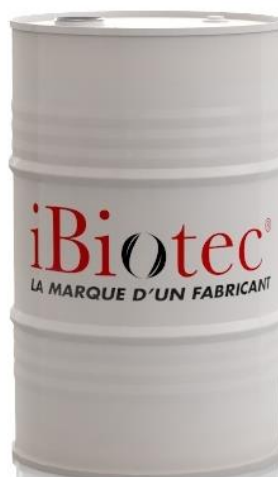
Barel s objemom 200 L